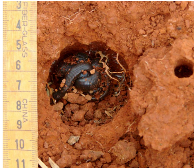
Minhocuçu em sua câmara subterrânea em solo do Cerrado