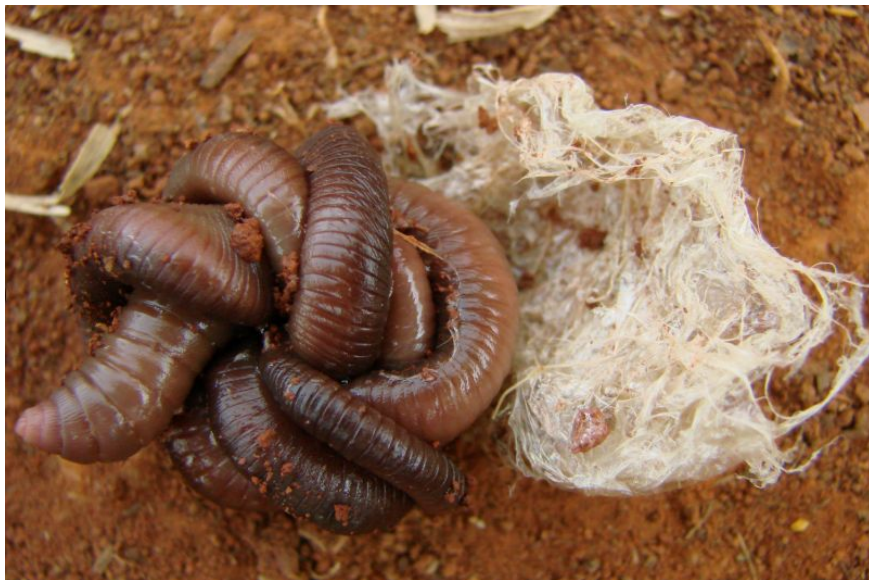
Minhocuçu ( Rhinodrilus alatus ) extraído de câmara subterrânea durante a época seca do ano