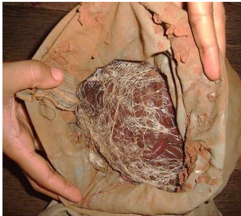
Sacolas de pano, confeccionadas por mulheres da região, para armazenamento de minhocuçus