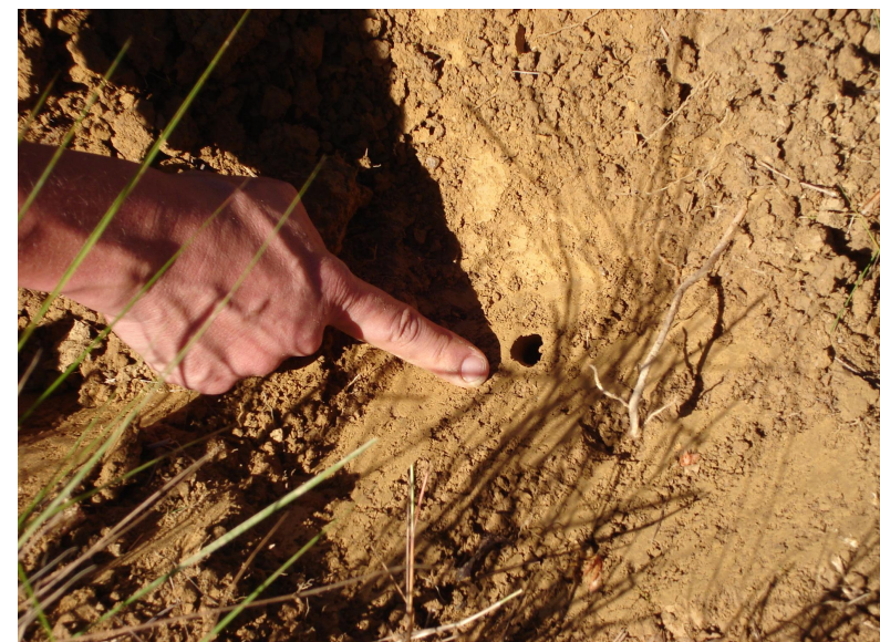
Abertura da câmara subterrânea que abriga os minhocuçus durante a época seca do ano