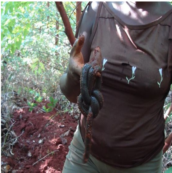
Minhocuçu recém coletado