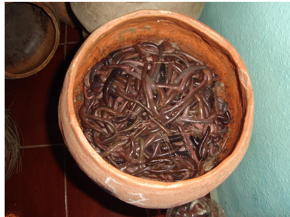
Minhocuçus armazenados em vasilha de barro produzida por mulheres